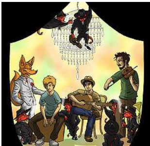
2014 « Prologue », un premier EP acoustique et festif