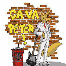
2016 « Ça va péter » un single coup de gueule qui rend hommage au spectacle vivant