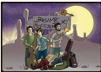
2015 « Brume de l'occident » un album rock et swing